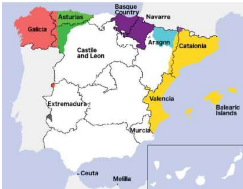
Mapa 2. Distribución geográfica de las lenguas minoritarias en España